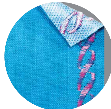
Stickerei mit Klebevlies