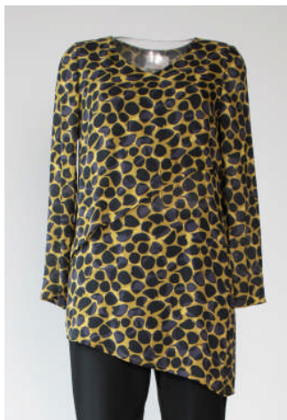
LAGENBLUSE 601 092