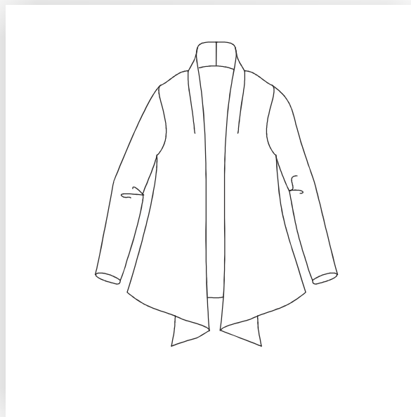
Lange weite Strickjacke